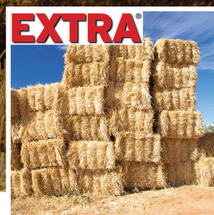
EXTRA ΣΠΑΓΚΟΣ ΧΟΡΤΟΔΕΣΙΑΣ

Κεντρικό: Λόφος Κυρίλλου (Έξοδος 4 Αττικής Οδού) Ασπρόπυργος Αττικής, 19300 Τ: 210-5584312-14, F: 210-5584315