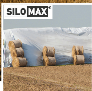
ΑΣΠΡΟΜΑΥΡΟ ΦΙΛΜ ΕΝΣΙΡΩΣΗΣ