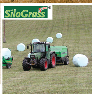
ΦΙΛΜ ΕΝΣΙΡΩΣΗΣ SILOGRASS 5 PLUS